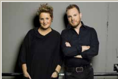
30. Juli - 2Flügel

Benefizkonzert - unterstützt durch RotaryClub Bruchsal-Schönborn