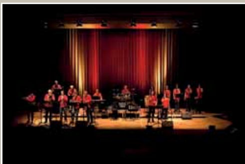
29. Juli - Modern Church Band

Benefizkonzert - unterstützt durch RotaryClub Bruchsal-Schönborn